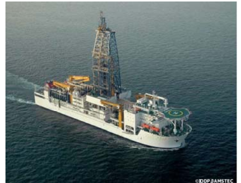
地球深部探査船「ちきゅう」