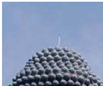
茨城県牛久市の阿弥陀大仏